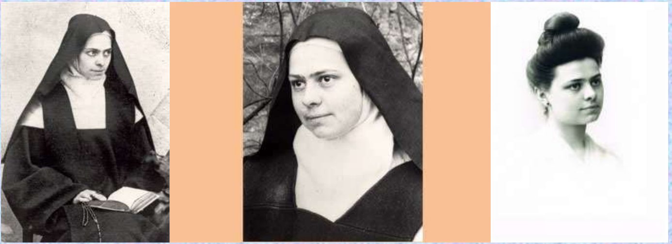
Sainte Elisabeth de la Sainte Trinité (1880-1906)