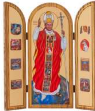
18) Triptyque « Marie-Résurrection-Miséricorde » 19) Triptyque « Jésus, j'ai confiance en TOI » 20) Triptyque « Saint Jean Paul II – Pèlerin du monde »